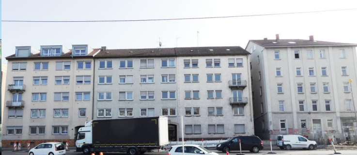
Willy Brandt's Straße verliert mit S21-Hausabbrissen seine letzten Wähler, die Demokratie wagen wollten