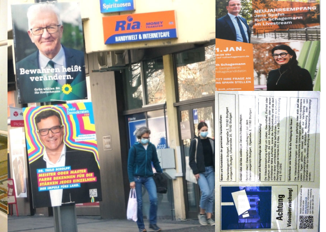
Grün-Schwarz: Wo bleiben Kompetenz & Demokratie?