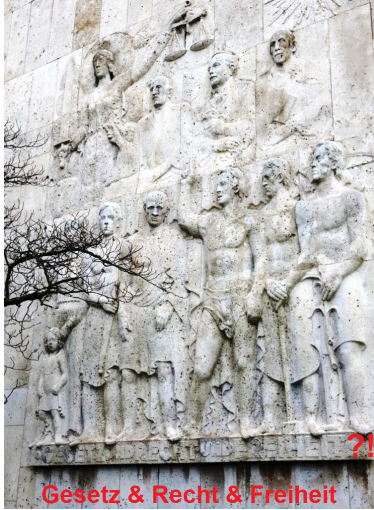
Gesetz & Recht & Freiheit